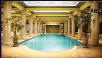
ÁREA COM PISCINA