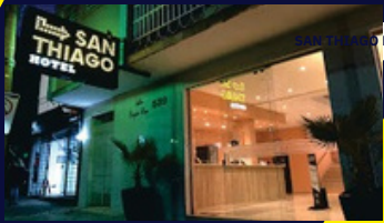
SAN THIAGO HOTEL